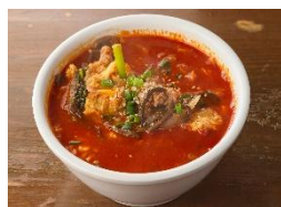
ユッケジャンスープ