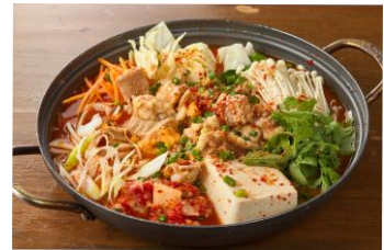
つぷチャンチョンゴル