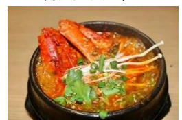
蟹入リスンドゥブ千ゲ