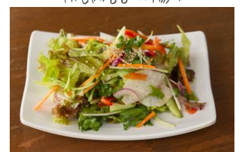
塩千ヨレギサラダ