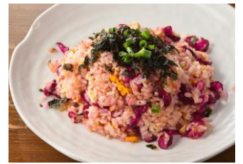
しば漬けチャーハン