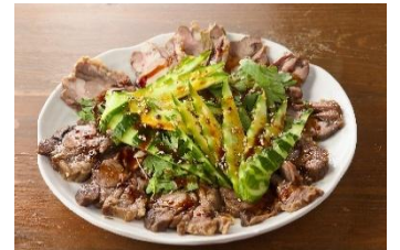
牛タンおじニンニクソース